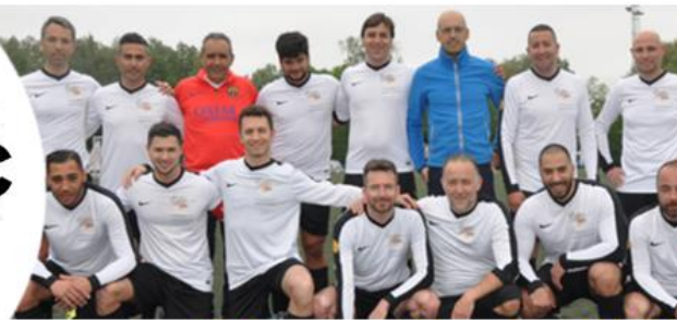
Schuman Trophy 2018