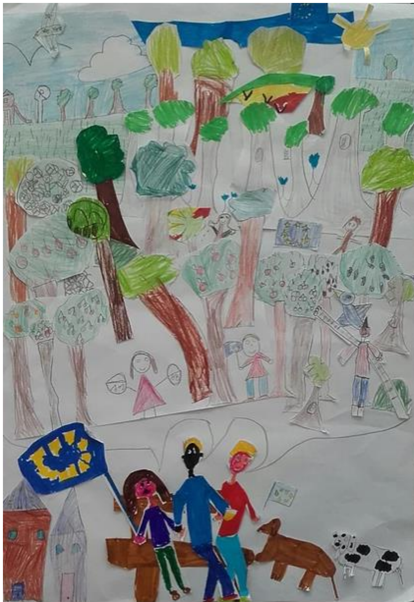
D 5 Classe P2 FR EE bruxelles 1